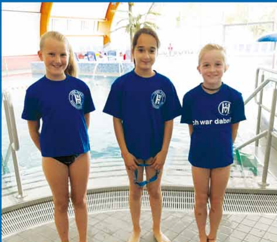
Nachwuchs der Hüllenger Schwimmabteilung wieder top in Form