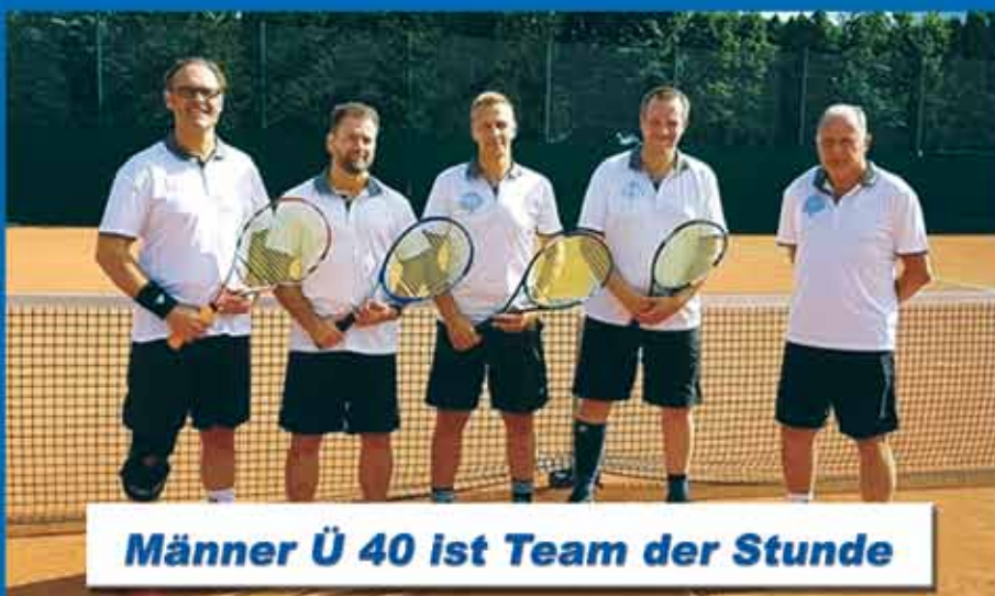
Männer Ü 40 ist Team der Stunde